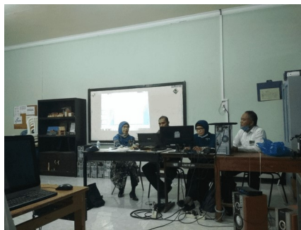
Gambar 7. Presentasi kelompok.