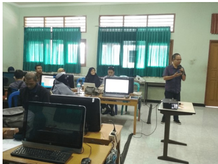
Gambar 8. Konsolidasi oleh Tim Fasilitator.

Hasil evaluasi Workshop 2 menunjukkan keberhasilan kegiatan presentasi dan konsolidasi. Khalayak sasaran merasakan manfaat dari kegiatan Workshop 2 sebagaimana tertuang pada Gambar 8 berikut.