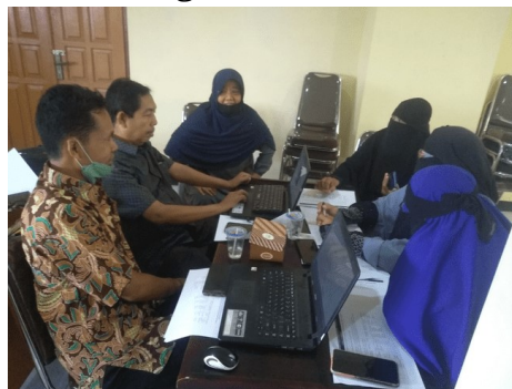
Gambar 5. Kegiatan diskusi kelompok.

Dalam kegiatan diskusi kelompok, peserta workshop memaparkan permasalahannya masing-masing untuk kemudian ditetapkan sebagai cikal bakal proposal yang akan dikembangkan. Setelah penetapan masalah, peserta kembali mengisi tabel step-by-step development yang ada di GC Guru Menulis. Dari hasil diskusi dihasilkan 4 draft proposal dengan melibatkan 20. Draft tersebut selanjutnya dikembangkan secara berkelompok. Masing-masing kelompok berkolaborasi untuk mengembangkan menjadi draft proposal PTK dan didampingi oleh Tim Pengabdian.