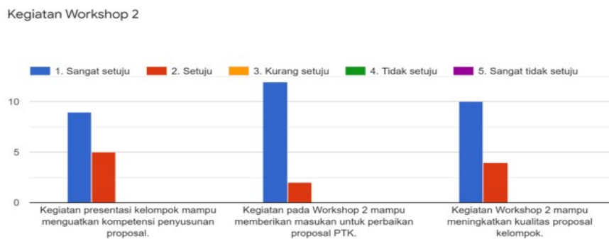
Gambar 9. Grafik Evaluasi kegiatan presentasi dan konsolidasi.

Hasil evaluasi Workshop 2 menunjukkan keberhasilan kegiatan presentasi dan konsolidasi. Khalayak sasaran merasakan manfaat dari kegiatan Workshop 2 sebagaimana tertuang pada Gambar 8 berikut.