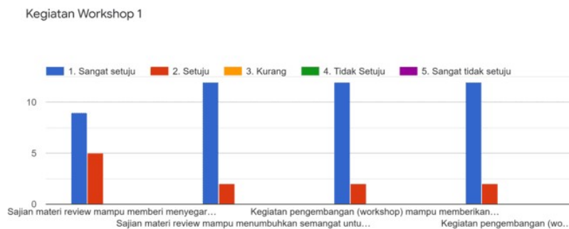
Gambar 6. Grafik Evaluasi kegiatan Workshop 1.

Dari evaluasi pelaksanaan kegiatan Workshop 1, khalayak sasaran memberikan respon positif kegiatan pembekalan dan workshop yang dilaksanakan secara offline . Hasil secara lengkap bisa dilihat pada Gambar 5 berikut.