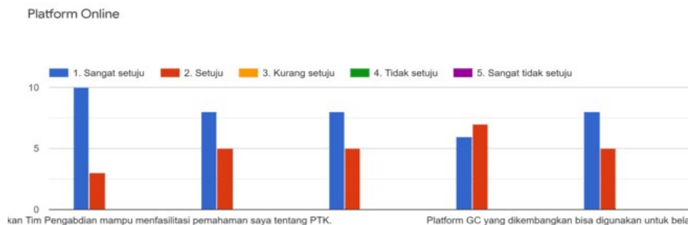
Gambar 3. Grafik Evaluasi Platform Google Classroom.

Dari evaluasi terkait dengan Platform Google Classroom “Guru Menulis” yang dikembangkan Tim Pengabdian, khalayak sasaran memberikan respon positif. Hasil tersebut disajikan pada Gambar 3 berikut.