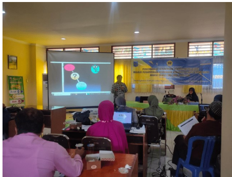
Gambar 4. Penyampaian materi oleh Tim PKM.

Dalam kegiatan diskusi kelompok, peserta workshop memaparkan permasalahannya masing-masing untuk kemudian ditetapkan sebagai cikal bakal proposal yang akan dikembangkan. Setelah penetapan masalah, peserta kembali mengisi tabel step-by-step development yang ada di GC Guru Menulis. Dari hasil diskusi dihasilkan 4 draft proposal dengan melibatkan 20. Draft tersebut selanjutnya dikembangkan secara berkelompok. Masing-masing kelompok berkolaborasi untuk mengembangkan menjadi draft proposal PTK dan didampingi oleh Tim Pengabdian.