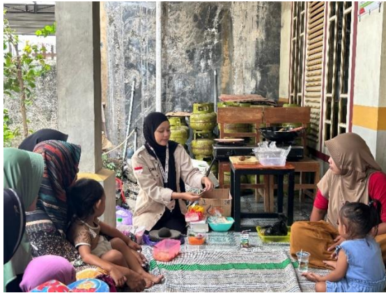
Gambar 3. Demo Masak PMT Stunting.