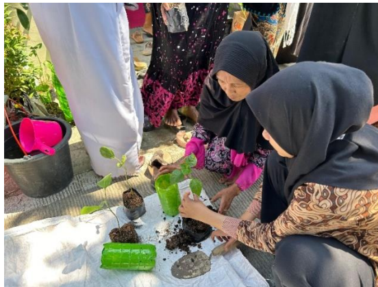
Gambar 2. Kegiatan Desa Peduli Sampah dan Penghijauan.