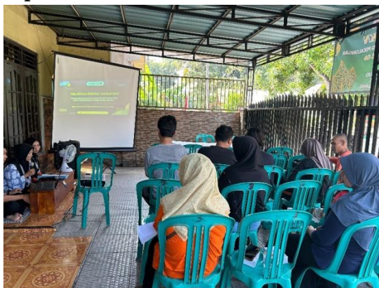
Gambar 4. Pelatihan Digital Marketing.