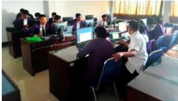
Gambar 3. Praktik penggunaan Zotero oleh peserta pelatihan.

Pada gambar 3 diperlihatkan pemateri sedang memberikan asistensi dan pendampingan ketika peserta materi pelatihan memberikan bantuan kepada para peserta pelatihan dengan menggunakan komputer ataupun laptop. Banyak dari peserta yang masih awam dalam penggunaan Zotero ini sehingga pemateri atau tim PKM memberikan pendampingan langsung kepada peserta.