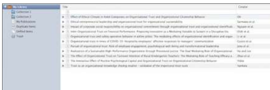
Gambar 2. Tampilan Zotero.

Dari kritik, saran, dan perbaikan serta komentar tersebut, hal yang perlu diperhatikan adalah durasi waktu pelatihan yang dirasa masih kurang bagi peserta untuk tiap sesi sehingga mungkin perlu ada pra-kegiatan atau tindak lanjut dari kegiatan ini agar semua peserta benar-benar paham tentang manajemen referensi dan sitasi menggunakan Zotero atau aplikasi lainnya.