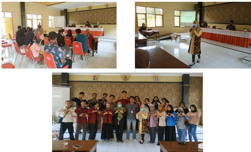
Gambar 2. Foto-foto Kegiatan Pelatihan Public Speaking di FORNAGEL.

Dari hasil evaluasi di atas sangat dimungkinkan untuk dilakukan kegiatan abdimas ke depannya yang berfokus untuk memberikan kesempatan praktikum secara lebih leluasa. Selain itu, sangat berpeluang untuk dilakukan teknik public speaking yang ditujukan untuk konten dalam media-media sosial yang digunakan sebagai media sosialisasi program FORNAGEL.