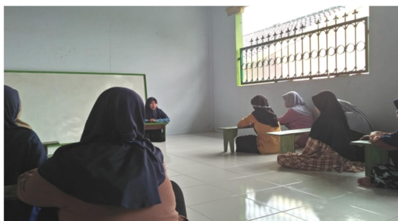
Gambar 1. Pemberian materi mengenai pengelolaan keuangan.

Kegiatan pendampingan ini berjalan dengan baik karena adanya antusias dari para santri didalam mengikuti kegiatan pendampingan. Melalui kegiatan sosialisasi ini para santri dapat memahami mengenai Pengelolaan Keuangan santri dengan baik. Antusiasme santri ditunjukkan juga dalam kegiatan FGD dengan banyaknya pertanyaan yang diajukan.