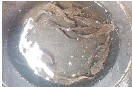
Gambar 6. Hasil panen ikan lele dengan sistem budidaya Budikdamber.

Sayuran kangkung darat pertama kali dapat dipanen ketika usia 2 minggu atau 14 hari setelah di tanam. Hasil awal panen sayur kangkung darat kurang lebih satu ikat per ember. Sedangkan ikan lele dapat dipanen minimal setelah berusia 2 bulan seperti tampak pada gambar 6.