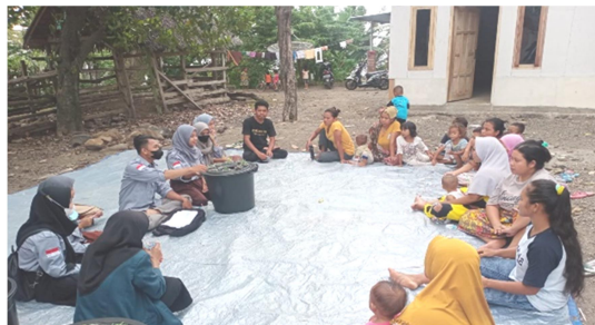
Gambar 2. Sosialisasi Budidaya Ikan Lele Dalam Ember (Budikdamber).

Sebelum memulai program utama KKN-PLP di desa Selengen kami melakukan survei ke lokasi yang bertempat di dusun Lembah Berora. Setelah tahap survei selesai, tim melakukan sosialisasi yang bertujuan untuk mengedukasi masyarakat dan membimbing mereka tentang sistem Budikdamber. Sosialisasi dan program utama kami dari KKN-PLP desa Selengen hanya memfokuskan bagi masyarakat yang menerima BLT-DD di desa Lembah Berora yakni sebanyak 8 orang. Sedangkan di Karang Bajo tahap sosialisasi dilakukan ke semua dusun dan program utamanya hanya difokuskan di satu dusun saja di rumah Bapak RT 01 dusun Lembah Berora.