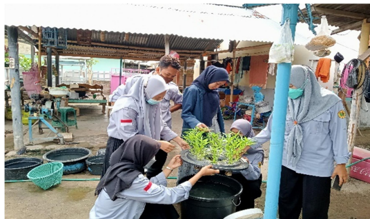
Gambar 5. Monitoring perkembangan Budikdamber.

Monitoring dan pengontrolan bertujuan untuk melihat perkembangan ikan dan tanaman sayuran kangkung. Monitoring dan pengontrolan ini dilakukan 3 kali dalam seminggu.