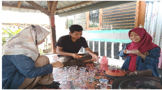
Gambar 3. Proses melubangi gelas plastik.