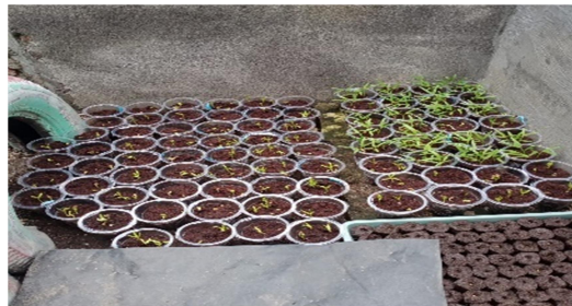
Gambar 4. Bibit sayur kangkung darat.