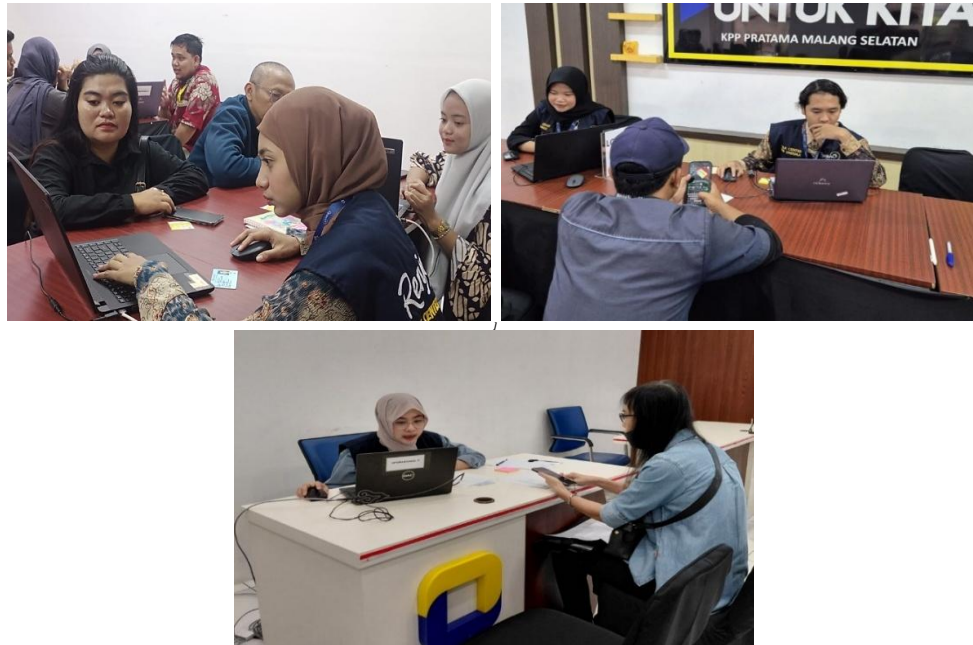
Gambar 2. Proses Pendampingan dan Pelaporan SPT Gabungan Suami-Istri.

Peserta sebagian besar berada dalam rentang usia 30-50 tahun (sekitar 68%), di mana 72% di antaranya memiliki istri yang bekerja atau memiliki penghasilan sendiri, sementara 55% tercatat punya riwayat kesalahan dalam menentukan status perpajakan semisal PH atau MT berdasarkan pengamatan awal. Rata-rata kehadiran dalam setiap sesi mencapai 92%, dengan 86% peserta rajin berdiskusi lewat grup WhatsApp sepanjang Maret-Mei 2026. Sepuluh relawan pajak berhasil menyelesaikan 156 konsultasi tatap muka, berkat dukungan lengkap dari KPP berupa ruang dan Coretax.