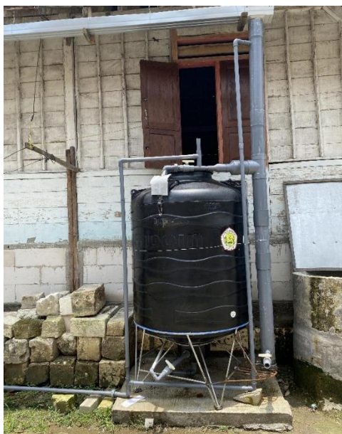
Gambar 3. Gambar sitem Instalasi Pemanen Air Hujan (IPAH).

Implementasi unit IPAH dengan tandon berkapasitas 1200 L ini memberikan dampak resiliensi yang nyata bagi rumah tangga mitra. Secara teknis, penggunaan tangki penyimpanan (toren air) sebagai sistem utama mampu mengurangi aliran limpasan ( run-off ) dari atap hingga lebih dari 70% dan menyediakan cadangan air bersih untuk kebutuhan domestik harian (Lestari & Susanto, 2021; Lubis, 2024). Dengan mengadopsi model sistem Pemanfaatan Air Hujan (PAH) sederhana ini, ketergantungan masyarakat terhadap bantuan eksternal dapat dikurangi, sekaligus memberikan penghematan finansial yang signifikan karena biaya operasional sistem ini sangat rendah, yakni hanya mencakup pemeliharaan rutin talang dan filter.