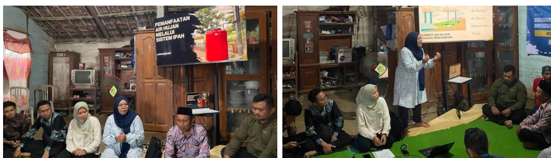
Gambar 2. Suasana Sosialisasi Partisipatif Mengenai Literasi Air dan Pemanfaatan Air Hujan.

Tim menjelaskan bahwa ketergantungan masyarakat pada bantuan dropping air bersih yang bersifat temporer, serta kendala kualitas air sumur gali yang tinggi kandungan kapur, menuntut adanya solusi yang lebih berkelanjutan. Melalui pendekatan partisipatif, masyarakat diajak untuk melihat potensi curah hujan tahunan di Kedungadem yang mencapai 1750–2250 mm/tahun (Huda et al., 2024) sebagai sumber daya yang belum terkelola optimal.