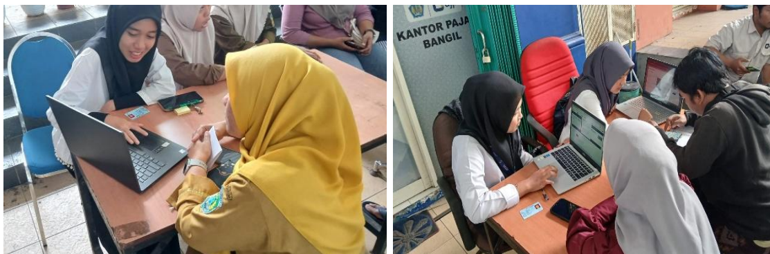
Gambar 2. Pendampingan Pelaporan SPT Tahunan Orang Pribadi.

Pada tahap pelaksanaan, metode pendampingan secara one-on-one terbukti efektif dalam membantu wajib pajak menyelesaikan pelaporan SPT Tahunan. Asistensi langsung ini sangat penting dalam memandu wajib pajak beradaptasi dengan aplikasi Coretax, yang merupakan pengembangan dari sistem e-Filing sebelumnya (Saprianto et al., 2026). Wajib pajak yang sebelumnya mengalami kesulitan login , pengisian data, hingga pengiriman SPT, dapat menyelesaikan kewajibannya dengan lebih cepat dan tepat.