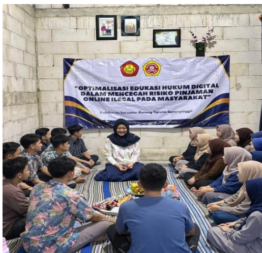
Gambar 2. Pemaparan Materi.

Pelaksanaan kegiatan pengabdian masyarakat di desa Semenpinggir dilakukan melalui metode sosialisasi hukum yang menyasar anggota Karang Taruna sebagai peserta utama. Kegiatan ini dilaksanakan di balai desa dengan penyampaian materi menggunakan media presentasi, diskusi interaktif, serta evaluasi melalui kuis dan tanya jawab. Materi yang diberikan meliputi pengenalan pinjaman online , perbedaan antara pinjaman online legal dan ilegal, risiko hukum yang dapat timbul, serta langkah-langkah pencegahan agar masyarakat tidak terjerat praktik pinjaman online ilegal (Hariyanto, 2025). Sejalan dengan Pawestri et al. (2022) bahwa sosialisasi dan edukasi hukum menjadi langkah penting dalam meningkatkan kesadaran masyarakat terhadap risiko pinjaman online ilegal serta mendorong masyarakat agar lebih bijak dalam menggunakan layanan keuangan digital.